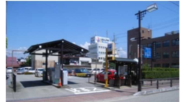
駐車場 駐車券500円分