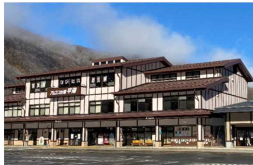
ドライブイン 等 お買物券500円分