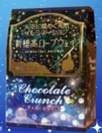
チョコレートクランチ 540円(税込)